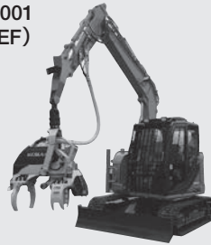
VHC 45203 001 (SK135SR-3F)