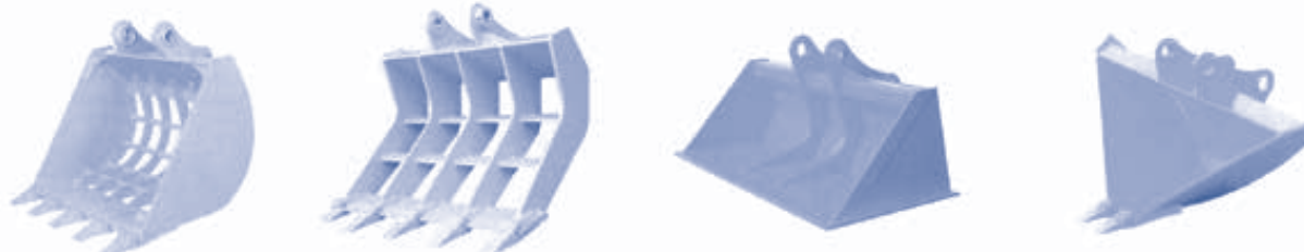
スケルトンバケット