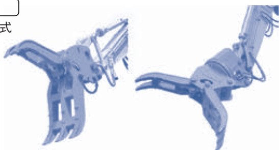
首振りグラスパー