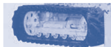
▲ゴムキャタ足廻り